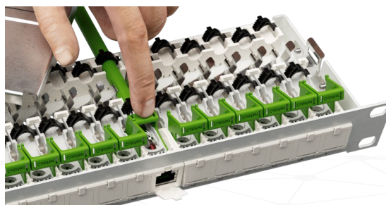
Abb.: Beschaltung der Adern mit einem Finger