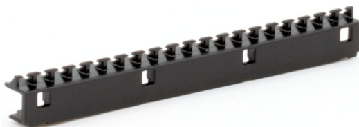
Abbildung 1: Zugentlastungskamm

Verhindert ungewolltes Herausziehen der elektrischen Leitungen.